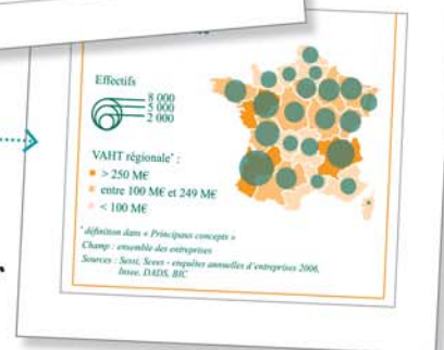
Répartition des effectifs dans un secteur