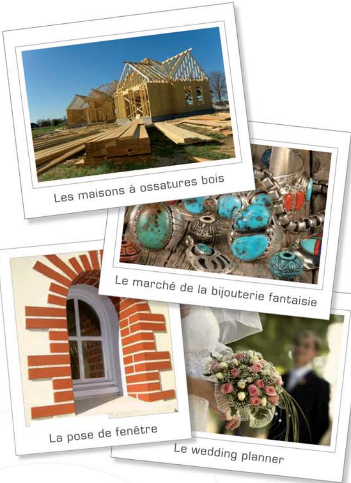
Les maisons à ossatures bois