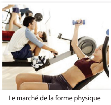
Le marché de la forme physique

Coût : Sur devis, selon tarif journalier du Chargé d'Études (550 € HT, 660 € TTC)