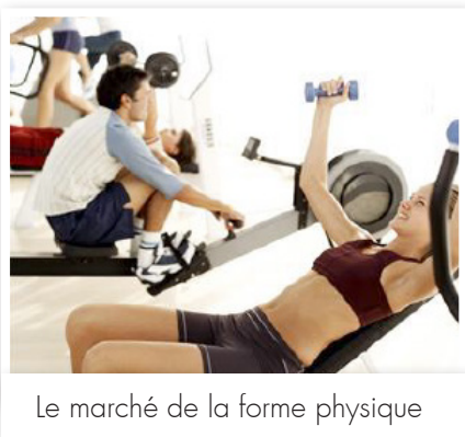
Le marché de la forme physique